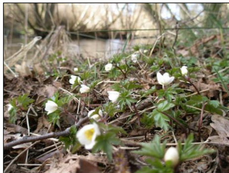
Forår på Nørager