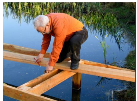
Et sjældent syn at se formanden lave noget...