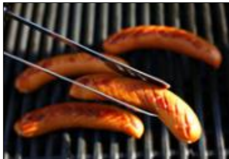
Grillen er klar!

Der kan ikke sættes en dato på allerede nu, da vejret afgør om turene bliver til noget, så hold øje med hjemmesiden og Facebook.