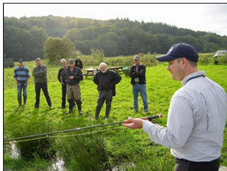
Demonstration ved kastesøen