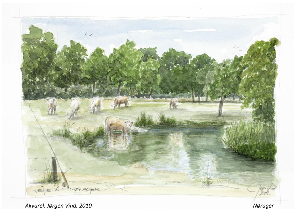
Akvarel: Jørgen Vind, 2010