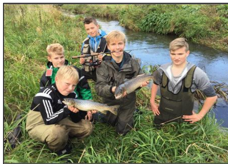
Juniorer kan også...

Alle der er mellem 18 og 25 år kan møde op. Det kræver ikke tilmelding, man kommer bare forbi til en snak og en kop kaffe.